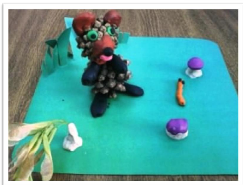
Вид: барельеф из пластилина Тема «Лес». Пейзаж (береза, дуб, яблоня, елка – в/д)